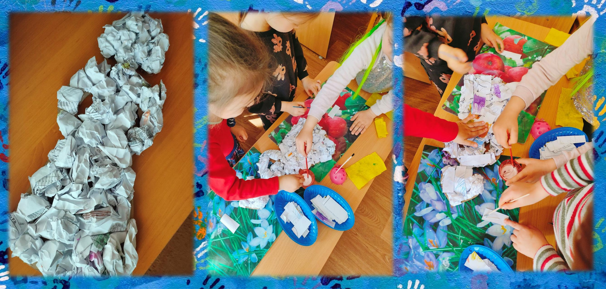
Дизайнерская деятельность детей: изготовление куклы в русском народном костюме